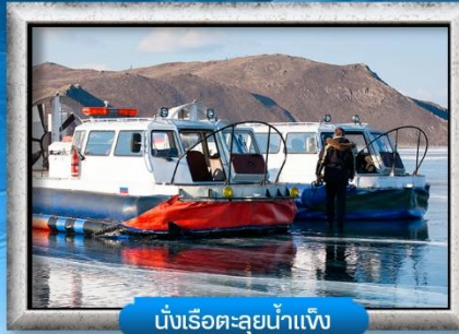
นั่งเรือทะเลสาบน้ำแข็ง