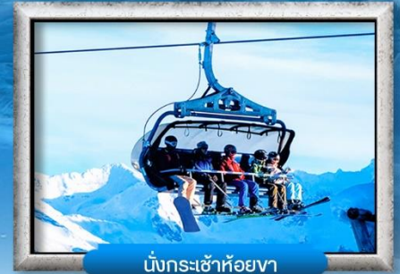
นั่งกระเช้าห้อยขา