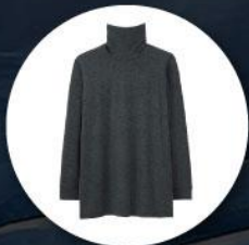
Heattech (ฮิกเทค) แบบหนาพิเศษ ทั้งกางเกงและเสื้อ

1. เสื้อผ้าควรเตรียมเสื้อผ้าสำหรับป้องกันความหนาวใช้ในอุณหภูมิต่ำสุด -40 องศาโดยประมาณ